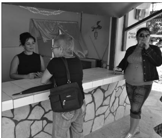
La juguera del pueblo.

Justo a la salida del municipio, en un lugar muy céntrico, se encuentra la juguera construida en el marco del proyecto. Un servicio ejemplar y una oferta variada de jugos de guayaba, piña, naranja, fruta bomba, entre otros, hacen que la “juguera del pueblo” sea un gran hervidero de personas entre las que procesan las frutas, las que están pendientes de su refrigeración y las que llegan para consumir el refrescante néctar. No faltan las buenas recomendaciones del lugar y entre ellas, destaca la de un conductor de ómnibus turístico que, de pasada por el municipio, solicitó el libro de quejas y sugerencias. Ante la sorpresa y preocupación de las encargadas, el conductor apuntó “es solo para escribir que este sitio debe ser una parada obligatoria para todas las personas que lleguen a Jesús Menéndez; los jugos son muy buenos y la atención es de primera” .