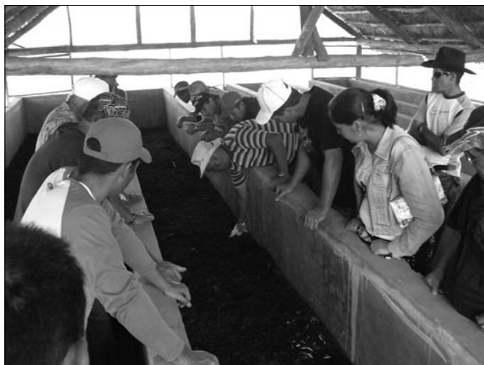
Capacitación e intercambio sobre la producción de humus de lombriz.