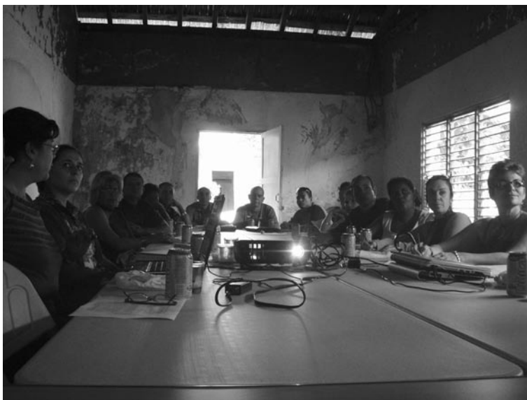
Reunión de coordinación.

El momento inicial o punto de arranque de la experiencia fue caracterizado por los propios actores desde los elementos favorables y los desafíos a enfrentar 10 . Se hizo en los siguientes términos (ver cuadro 1 en la siguiente página):