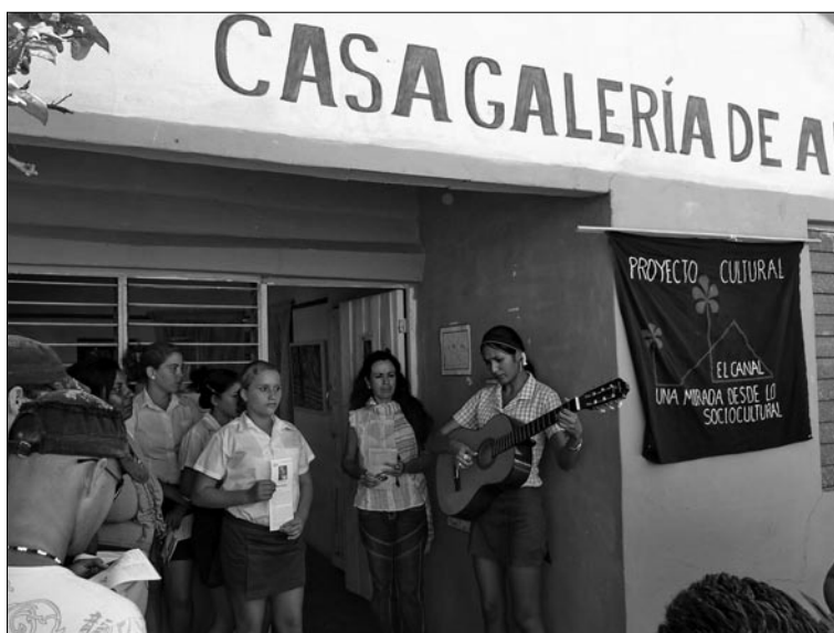
Casa Galería de Arte.