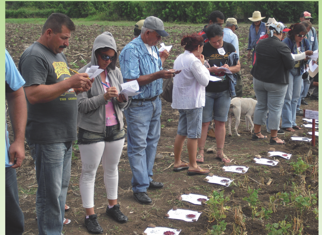
Productores (as) seleccionan semillas de frijol.