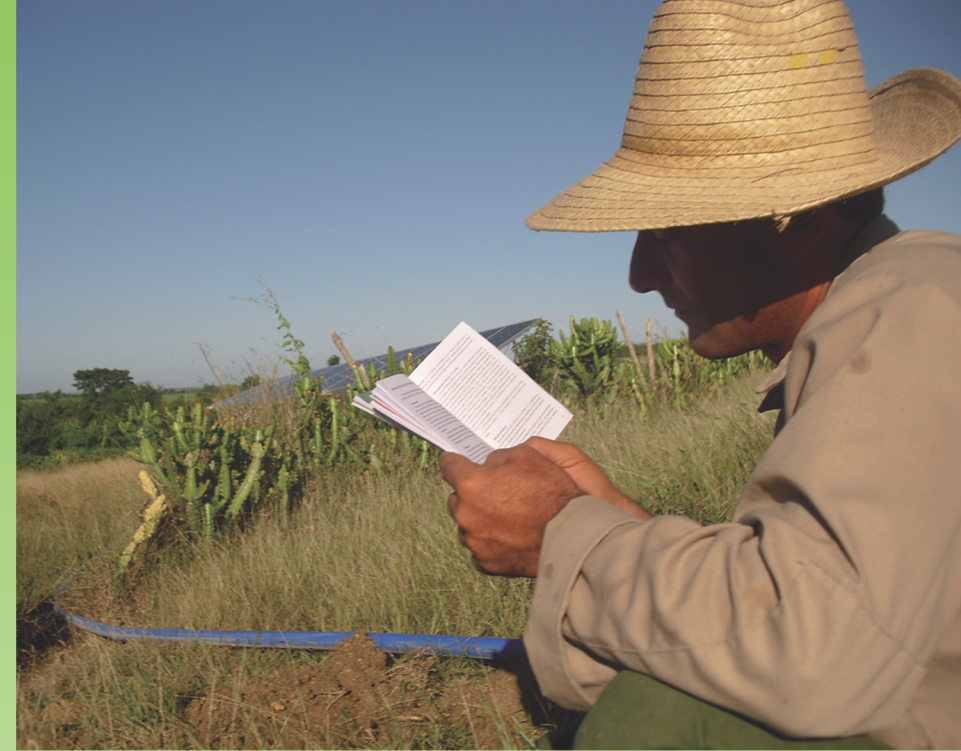
Al recibir los instructivos técnicos, bajó del caballo y se puso a leerlos.