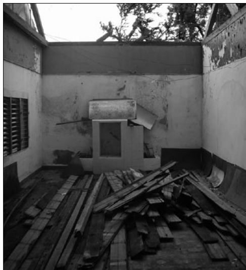
Aula de capacitación después de Ike.