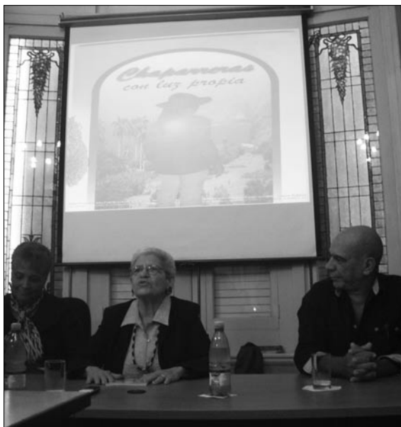
Chaparreras se presentan con luz propia en la XXI Feria Internacional del Libro, La Habana, 2012.

hacerse parte orgánica de su funcionamiento, aunque también se han ido perfilando y ajustando los contenidos de la propia estrategia.