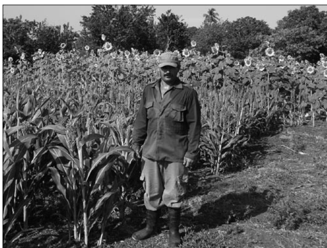
Diversificación de cultivos.