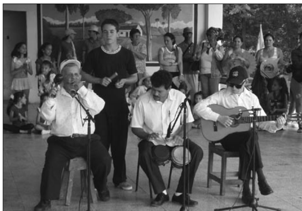
Grupo musical compuesto por personas con alguna discapacidad.

Al igual que en la dimensión de género, se trabajó también con un grupo gestor del proyecto sociocultural encargado de conducir y facilitar el desarrollo de estos espacios en la comunidad “El Canal”. Sin embargo, el trabajo sociocultural se ha extendido con apoyos puntuales y compartiendo recursos para necesidades específicas, a otras cuatro comunidades, las siete casas abiertas y los 13 barrios, a grupos municipales de música, danza y teatro, los promotores culturales y los instructores de las cuatro casas de cultura del municipio.