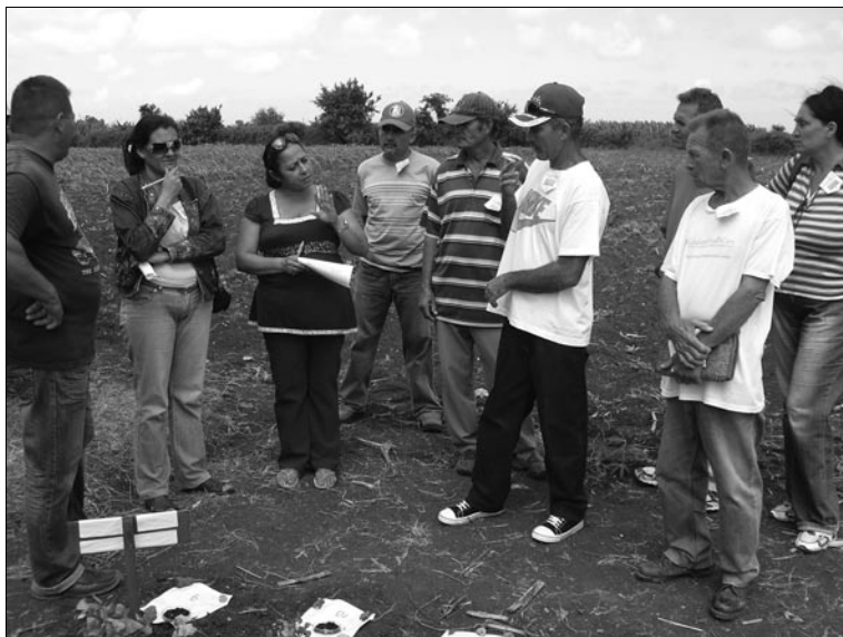
Capacitación e intercambio en el terreno.

La integración de los intereses, esfuerzos y capacidades de actores municipales –que en ocasiones incluye a actores provinciales– en el área de la capacitación, dimanó de las necesidades identificadas por los propios actores cuando cada quien comenzó a realizar sus respectivas acciones, a la usanza de trabajo tradicional, y se evidenciaron choques, vacíos, superposiciones, así como las potencialidades del trabajo conjunto para elevar la calidad de las acciones.