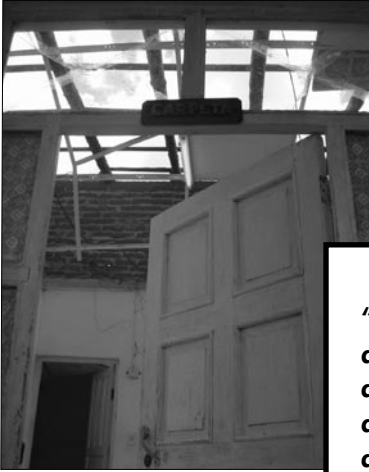
Entrada del Hotel municipal después de Ike.

“El hotel fue destruido con el huracán. Desde que abrimos estamos llenos. En diciembre vendimos más de 100 000 pesos. Acá hay empresas que quieren alquilar habitaciones permanentemente, pero le damos prioridad a la población” (Administrador del hotel).