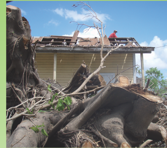
Recuperando materiales para reparar el techo.